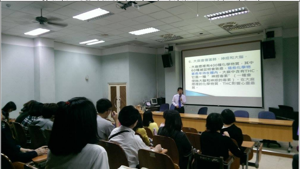
毒品對人體的危害