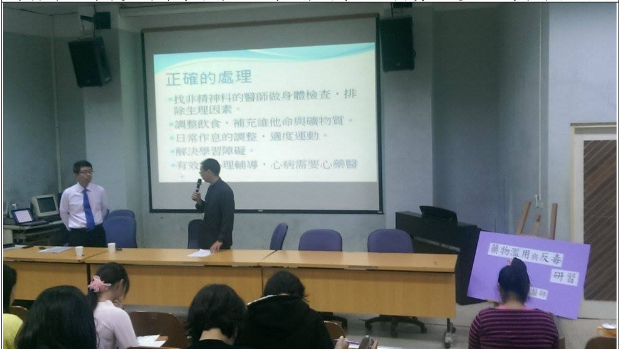
校長感謝蘇醫師無私的奉獻