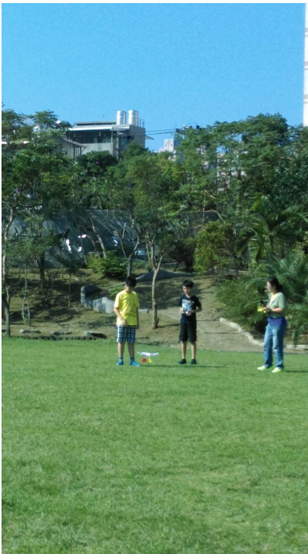
請護眼小尖兵駕駛遙控飛機 並於飛機上掛色卡，讓學生觀察

請學生駕駛遙控直昇機，於直昇機上掛顏色小卡，讓學生可以追蹤望遠，讓眼睛可以放鬆。結束後發下抽獎視力保健抽獎單，進行有獎徵答活動。