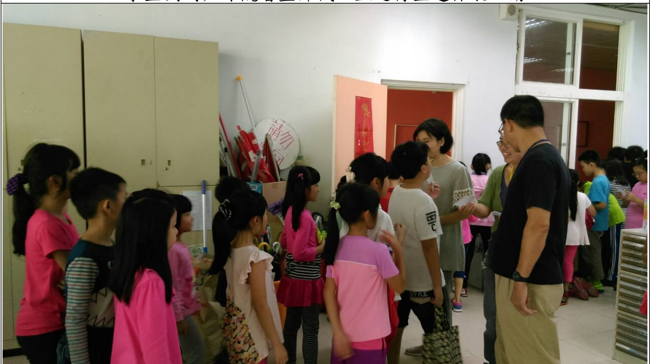
排隊領取抽獎單的盛況