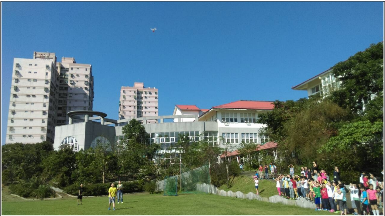
學生們到戶外觀看直昇機，並進行望遠保眼活動