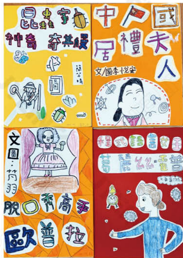
406 簡千晴 李悅安 陳凡羽 蕭羽玲

經過這次的活動，未來在日常生活中，我要主動幫忙老人。如果有老人家要上下樓，我會幫忙他們扶著，讓他們比較不會跌倒受傷，同時我也學到，要好好照顧自己，多運動多喝水、飲食均衡，讓身體更健康，這樣以後我老了才不會太辛苦。