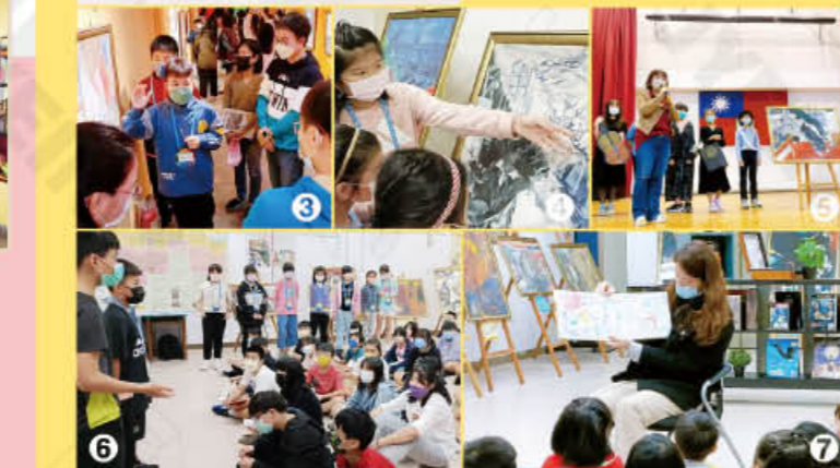
四年級夏卡爾主題創作-藝術深耕陶藝創作