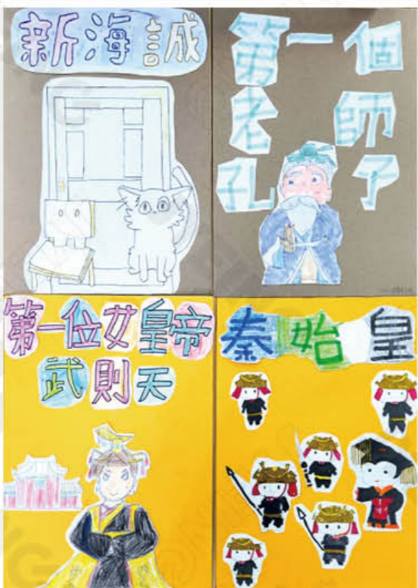
402 鍾沁璇 陳柏嘉 陳承非 王筠婕

以後我會努力學習自己不知道、不解的地方，不會因為自己不喜歡，就放棄了解新事物的機會，在不小時可以問師長，讓自己更加充實。