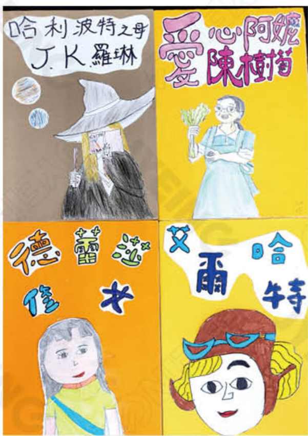
405 簡語 賴廖嫻 陳以薰 李羽晴