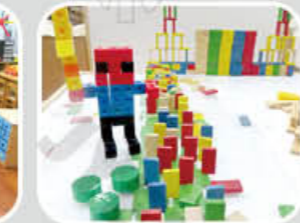
傑克與豌豆 吳紹綱、楊子逸 廖子允、羅子紳