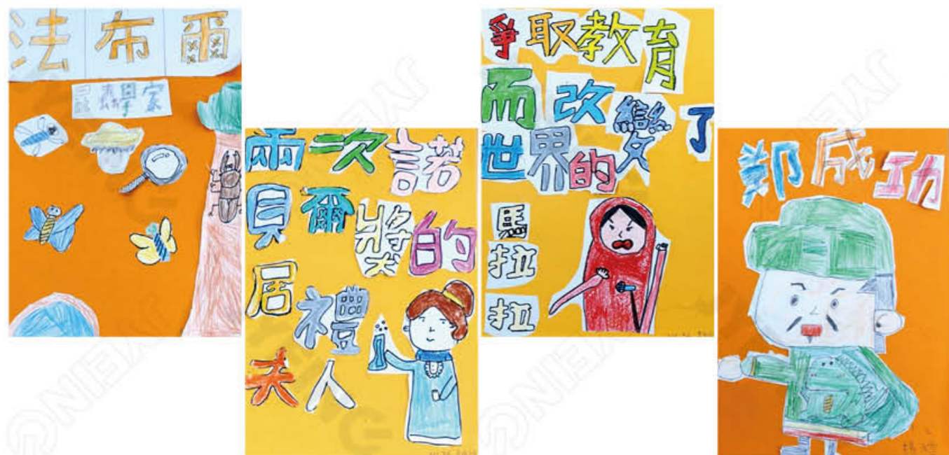
401 粘靖神 應雨臻 許鈞甯 楊又睿