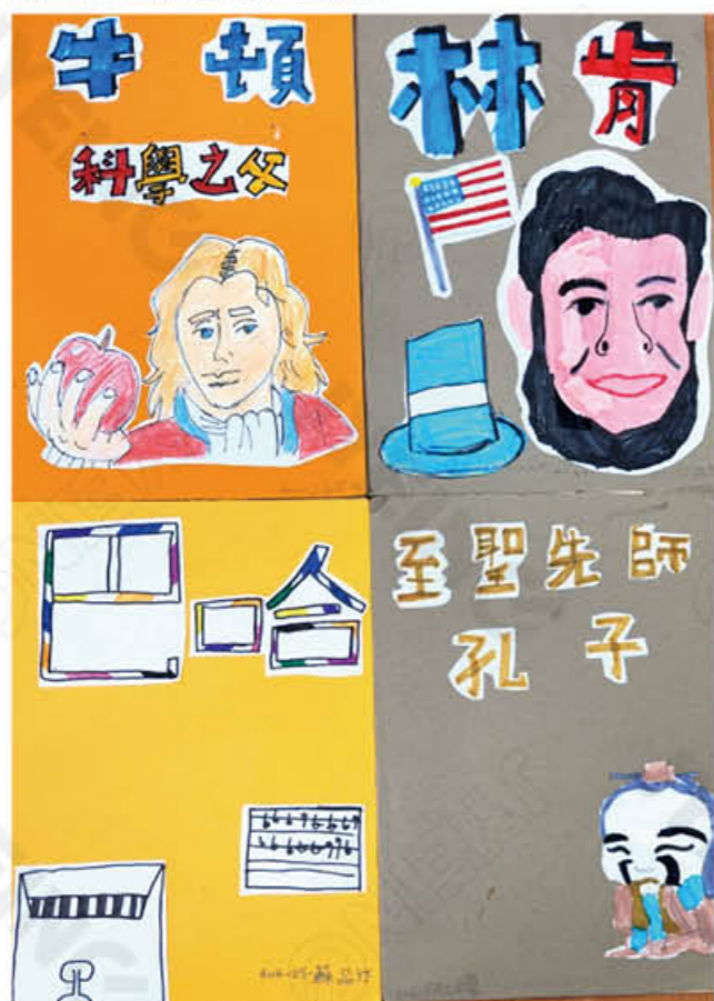
404 白哲希 江冠榮 蘇品竹 杜雨馨

我打架， 很厲害， 可把你送進急診。 不管是多強的敵人， 我都只知道， 打打打打打打， 永遠不會停下來。