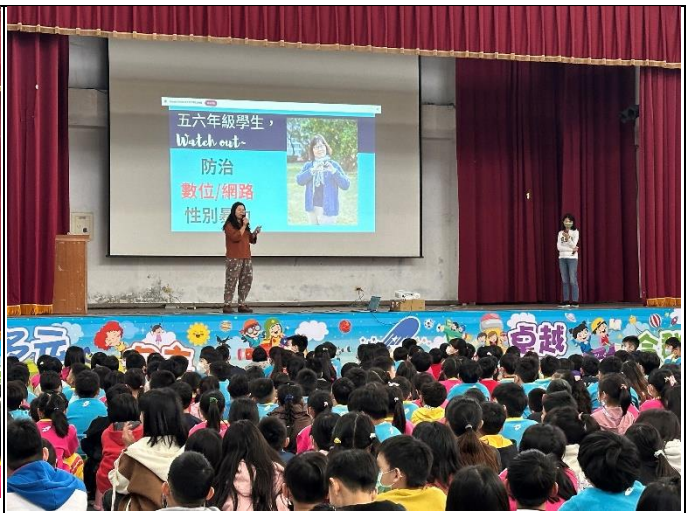
說明:113.03.27 性別平等暨繪畫比賽宣導, 運用 AI Presenter 請各處室主任現身說法, 提醒各年級學生該注意的地方。