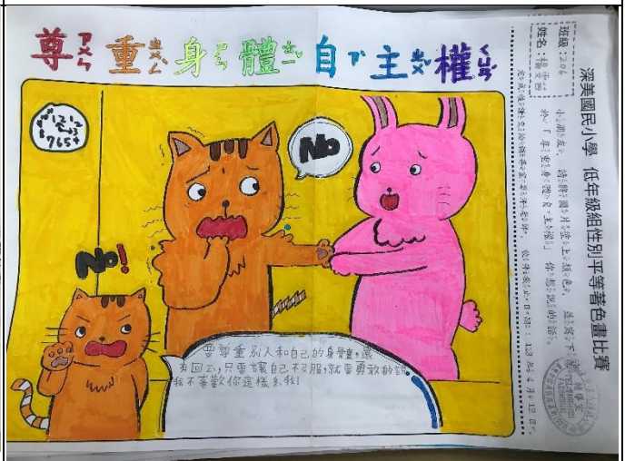
說明:性別平等繪畫比賽作品