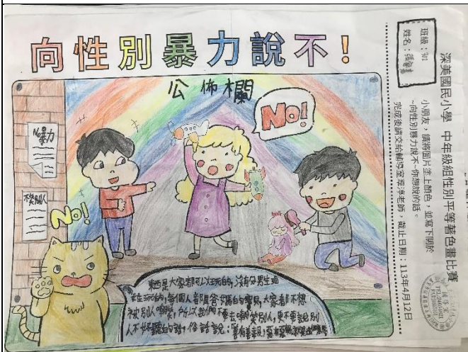
說明:性別平等繪畫比賽作品